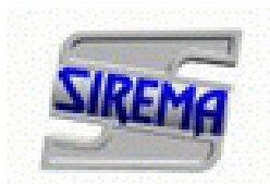
SIREMA Irányítástechnikai és Számítástechnikai Kft.