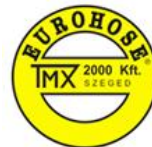
TMX 2000 Kft.